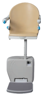
Siège Smart Perch